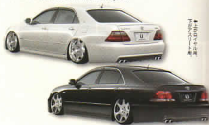
↑純VIP 180系クラウン用 下がアスリート用

●エイムゲイン TEL.082-423-2334 http://www.aimgain.net